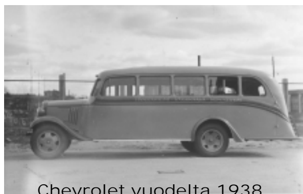
Chevrolet vuodelta 1938