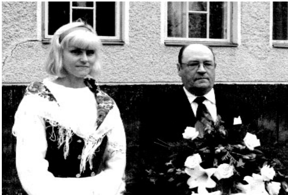
Sepeleenlaskijat lähdössä sankarihudoille.

nessa. Hän jäi eläkkeelle jo vuotena 27, joten vanhoja ovat nämä asia joita tässä riimitän.