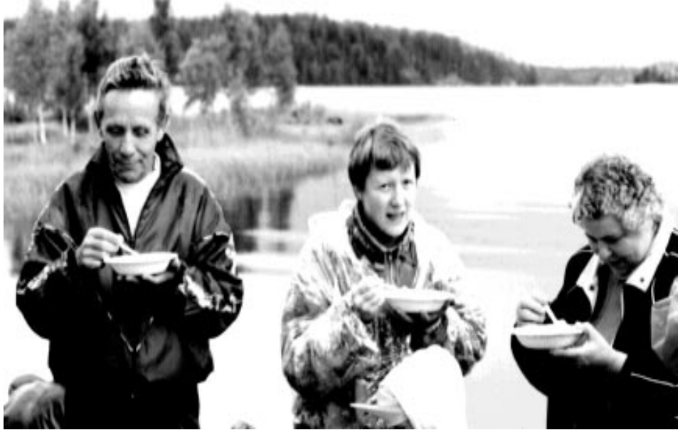
Lohikeitto maistuu jutustelun lomassa.