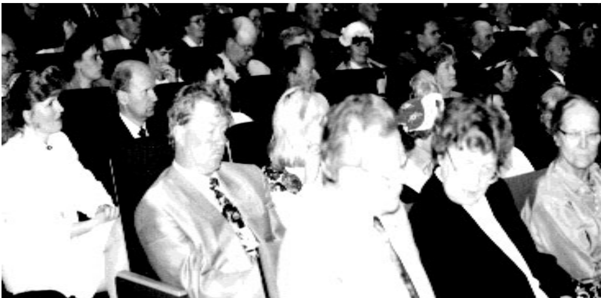
Sukujuhla vaati jo vakavampia ilmeita..

Hän muutti Sumiaisten asiat toiseen malliin, kun kunnalla ei ollut siihen aikaan edes talousarviota, ei tiedetty edes sen tarpeellisuudesta. Opettaja oli vuosikymmenet kunnanvaltuustossa ja ei ollut sitä hätäkää, johonka ei olisi haettu leikkisää Aukust Kor-