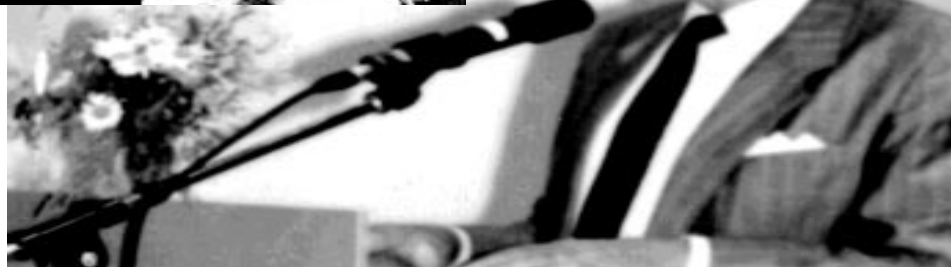
Eino Korhonen puhujana sukujuhlassa.

Myös Kotkaan on levinnyt Korhosia, Kotkan kaupunki on ottanut vastaan sinne saapuvia. Muurame-lainen Pekka Korhonen johtaa Tallinnan